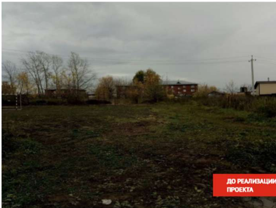
ДО РЕАЛИЗАЦИИ ПРОЕКТА