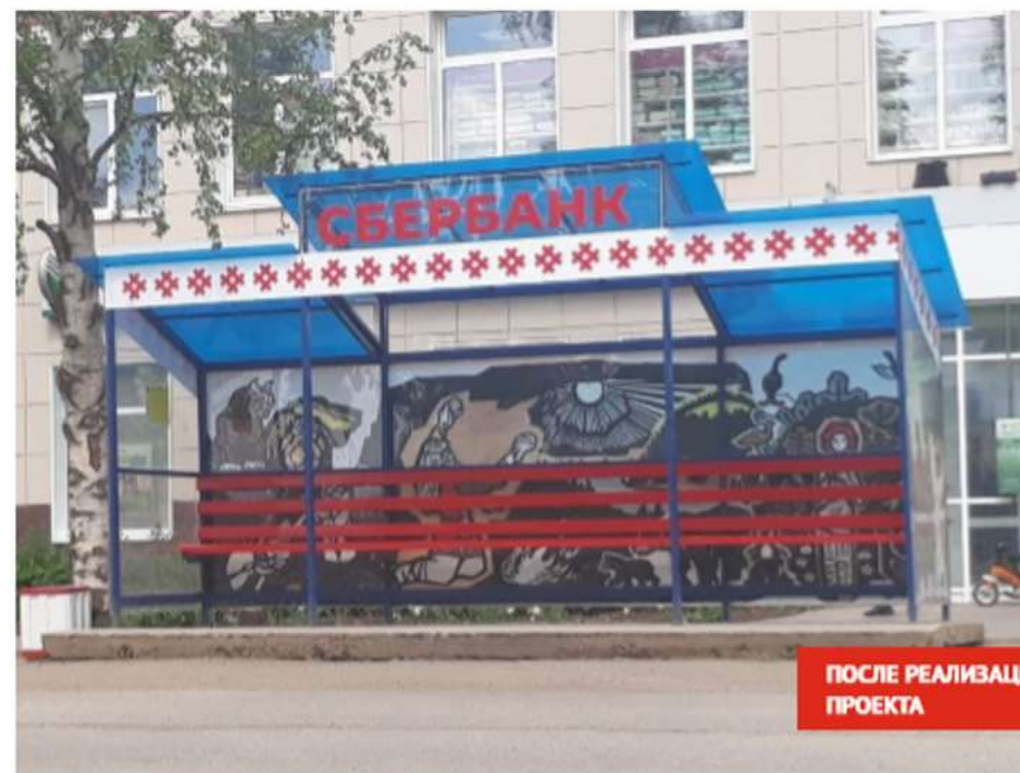
ПОСЛЕ РЕАЛИЗАЦИИ ПРОЕКТА