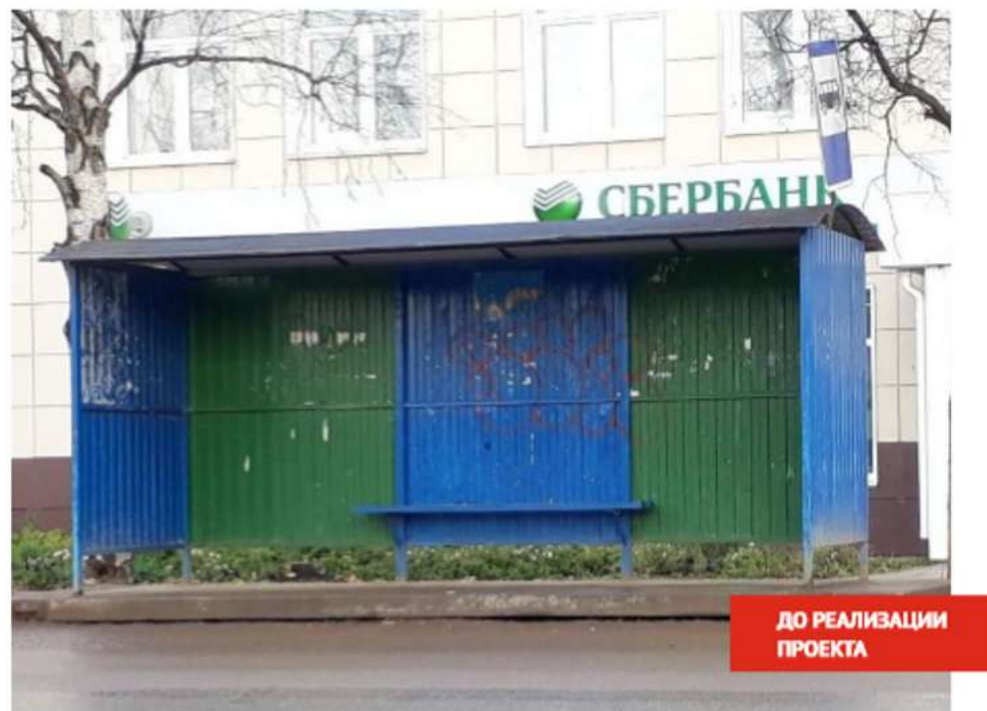
ДО РЕАЛИЗАЦИИ ПРОЕКТА