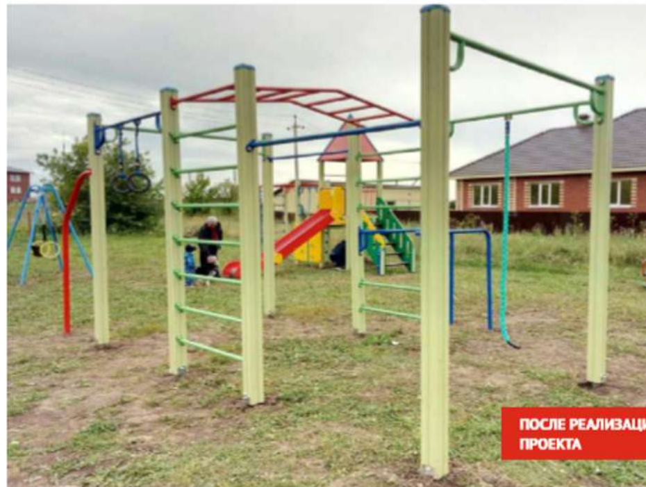
ПОСЛЕ РЕАЛИЗАЦИИ ПРОЕКТА