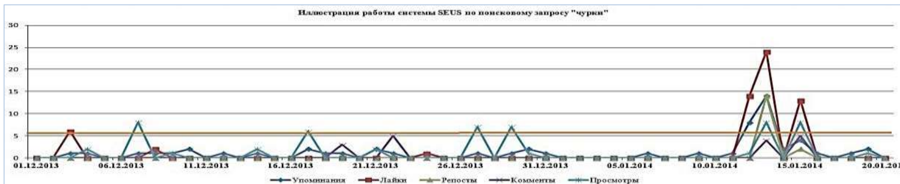
Иллюстрация работы системы SEUS по поисковому запросу "чурки"

Анализ контента социальных сетей по ключевым словам.